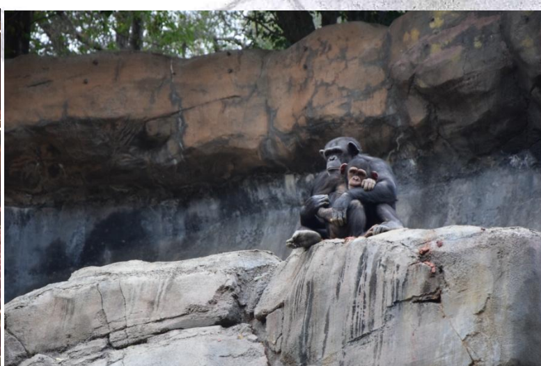
Živalski vrt v Los Angelesu