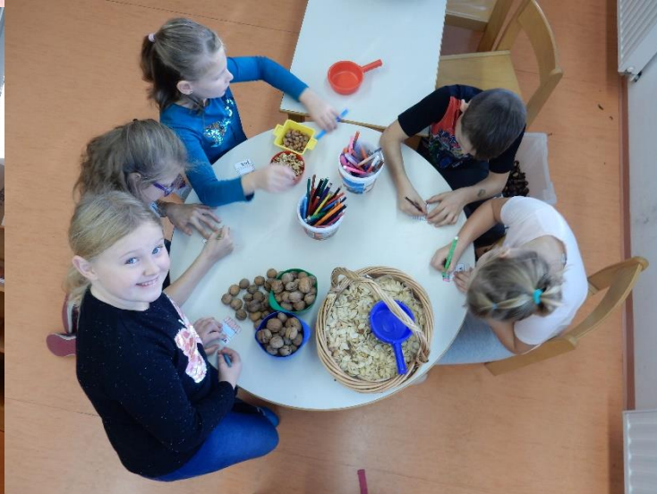
Tržnica že pripravlja svoje pridelke za prodajo.