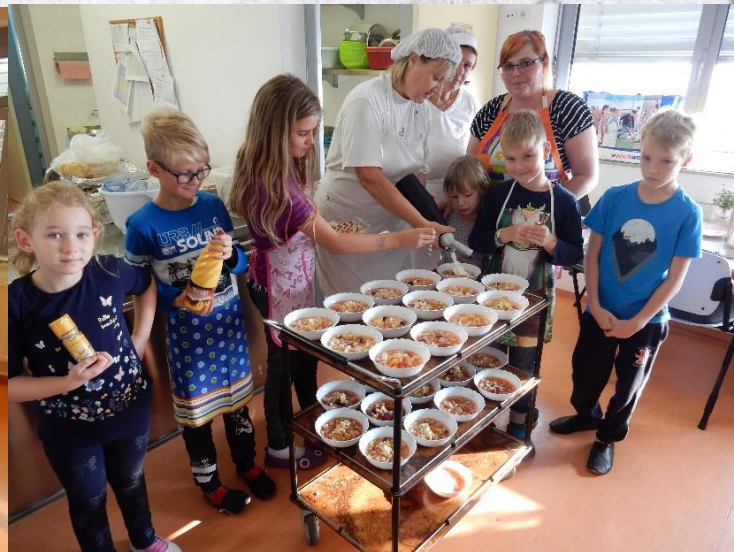
Mmmm, tukaj se pripravljajo sadne kupe.