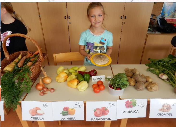
Kupite, kupite! Akcija samo danes.