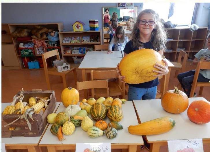
Uuuu, kako velika buča!