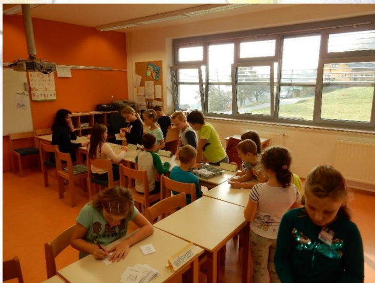
Dolga vrsta na banki. Vsi čakamo, da dobimo denar.