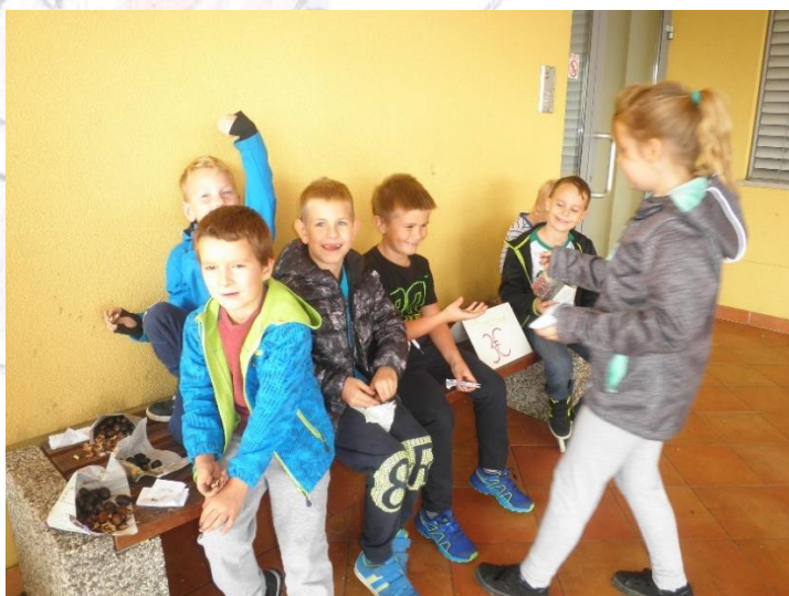
Luščimo in jemo kostanj.