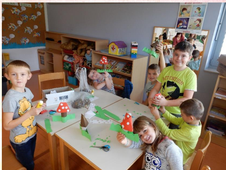
Ustvarjamo gobice in jesensko drevo.

Oktober smo izvedli naravoslovni dan. Učilnice so se spremenile v tržnico, banko, slaščičarno in ustvarjalno delavnico. Šolska terasa se je spremenila v prodajalnico kostanjev.