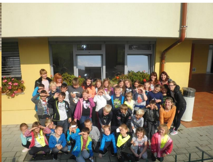
Ustvarjalci Tetke Jeseni